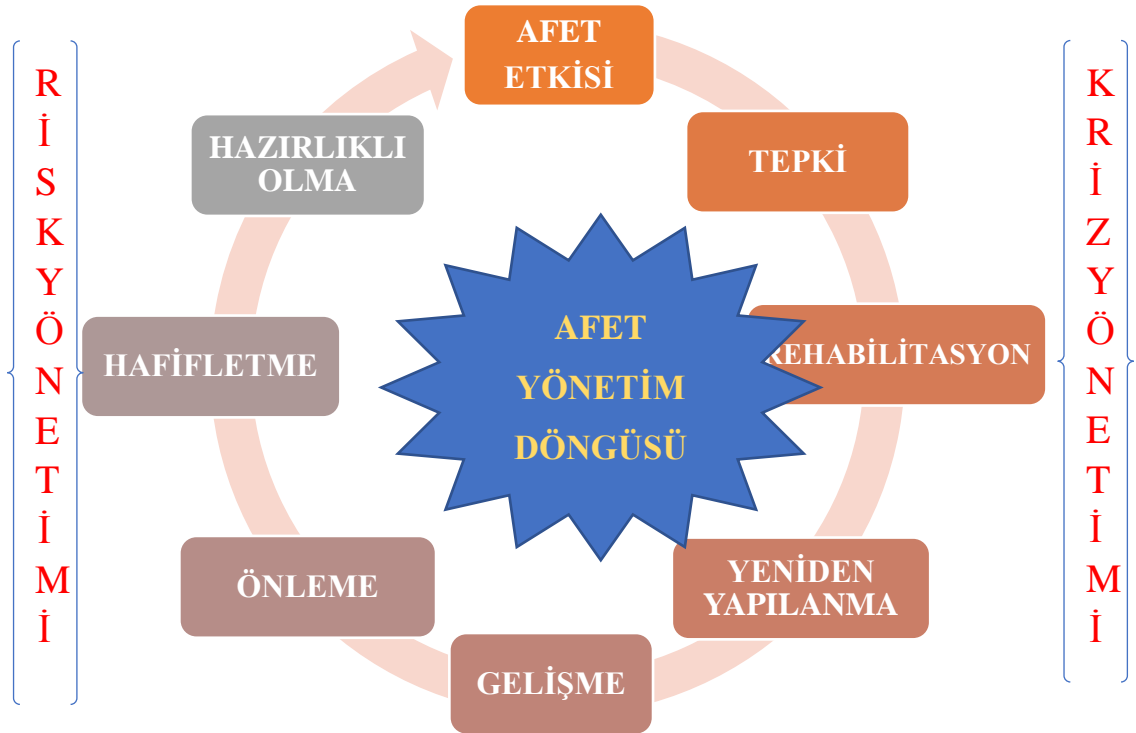
Şekil 1. Afet Yönetim Döngüsü

çıkart ve yetersiz hazırlık nedeniyle bu sorunlar kaçınılmazdır. Ancak yeterli hazırlık ile, olası veya mantıksız şeyler meydana gelir. Depremden sonra ortaya çıkan bir diğery yaygın şey söylentilerin yayılmasıdır. Söylenti, olumsuz ya da olumlu olabilir. Söylentilerin olumsuz etkisini önlemek için, güvenilir kaynaklar kurtulanlara bilgi vermelidir. Depremler önemlidir çünkü bireyleri, aileleri, toplulukları ve hükümet organizasyonlarını etkiler. Deprem deneyimlerinin kişi ve kuruluşun eğitimini geliştirmek için depremlerin bireyleri ve toplulukları nasıl etkilediğine dair temel kavramları anlamak önemlidir. Bu nedenle, topluluk üyeleri ve sorumlu eğitim liderleri olarak okul müdürleri, deprem meydana gelmeden önce, sırasında ve sonrasında nasıl başa çıkılacağını bilmelidir (McCaughey vd., 1994: 142).