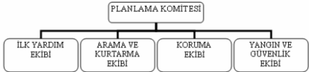
Şekil 2. Okul Afet Planında Görevli Birimler

Planlama işlemi afet öncesinde, sırasında ve sonrasında alınan tedbirleri içerir. Afetten önce alınan önlemler, afetlerde nasıl davranılacağını etkileyebilir ve bir afette daha verimli çalışma sağlayabilir. Örneğin, sınıflarda bir kriz anında kişilere zarar